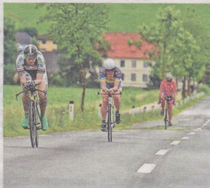
Das Zeitfahren in Althofen wird am Sonntag ab 9 Uhr gefahren. LÖSTINGE

Der Legrand Jedermann-Cup steht übrigens im Dienst der guten Sache. Pro Teilnehmer geht ein Euro an das karitative Projekt „bike4dreams“.